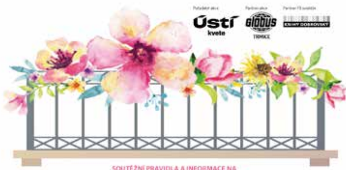
SOUTĚŽNÍ PRAVIDLA A INFORMACE NA

Zdravé město Ústí nad Labem vyhlašuje pro milovníky květin pátý ročník soutěže, která se těšila v předchozích letech velké účasti. Smyslem soutěže je podpořit a ocenit pěstitelské snahy, chuť zvelebovat městská obydlí zelení a krásnými květy. Stačí si svůj rozkvetlý balkón, terasu, lodžii nebo předzahrádku vyfotit a poslat. Vítězové budou odměněni dárkovými poukazy a věcnými cenami.