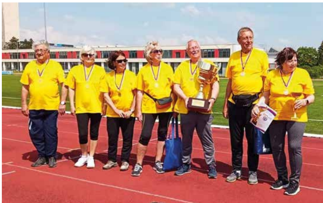
Vítězem sportovních her se stal tým z Horního Jiřetína a Černic.