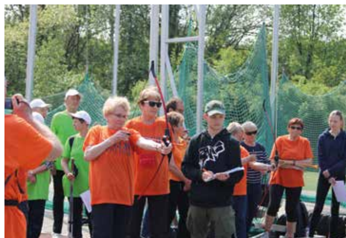
Jednou z disciplín zápolení seniorů byla lukostřelba.