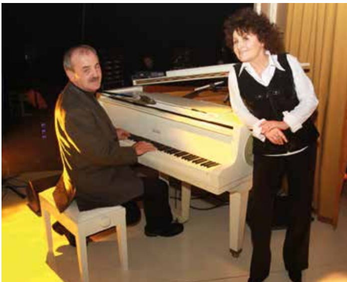
Často Pavel Větrovec doprovázel i Jitku Zelenkovou.

Pavel Větrovec, známý klavírista, kapelník a skladatel, se narodil 27. července 1949 v Ústí nad Labem. Začínal jako korepetitor ve Státním divadle v Ústí nad Labem, později pracoval v Klavíradle a ústeckém Národním domě, tehdejší Kulturní správě ONV, kde absolvoval i kapelnické zkoušky. Byl kapelníkem Velkého tanečního orchestru. Do Prahy se dostal díky Jiřímu Suchému, kdy zaskočil jako klavírista na jeho vystoupení v Ústí nad Labem. Působil i v Semaforu a od roku 1982 v Orchestru Ladislava Štáidla, kde byl od roku 1989 kapelníkem a který pak přejmenoval na Karel Gott Band a doprovázel s ním Karla Gotta až do jeho smrti.