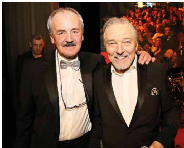
Poslední společné foto s legendou vzniklo v roce 2018.

Míval jsem tu mnoho oblíbených míst, dnes však vyhlíží většinou hodně odlišně od těch, která mám uložená ve své hlavě, a některá dokonce zmizela úplně. Mám tím na mysli například odstřelily domů ve Fučíkově, dnes Masarykově ulici, bourání v historickém centru města či demolici Bukova, kde jsem vyrůstal. Jako muzikantovi mi schází řada podniků, ve kterých pravidelně hrály kapely. Jen na samotném náměstí jich bylo několik a další jak v nejbližším okolí Grand, Savoy, tak i třeba na zmíněném Bukově, na Klíši, na Střekově. Prostě Ústí doznalo spousty docela zásadních změn a já nechci ani se necítím být oprávněn je nějak kritizovat, jen se domnívám,